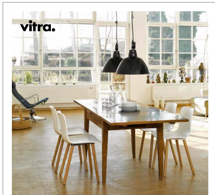
HAL, Jasper Morrison, Aluminium Chair, Charles & Ray Eames