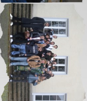
Besuch in der Mrs. Wilson Skatenhalle in Kassel mit Gruppenfoto