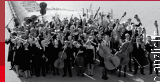
Stadt Bad Kreuznach

Samstag, 27. August 2016 von 16 bis 22 Uhr Sonntag, 28. August 2016 von 11 bis 17 Uhr im Trombacher Hof in Bad Münster am Stein