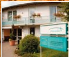
St. Antoniushaus 55583 Bad Münster a. St.-Ebernburg