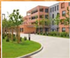
Haus St. Josef 55543 Bad Kreuznach