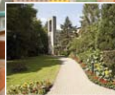
Haus Maria Königin 55606 Kirm