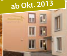
Puricelli Stift 55494 Rheinböllen