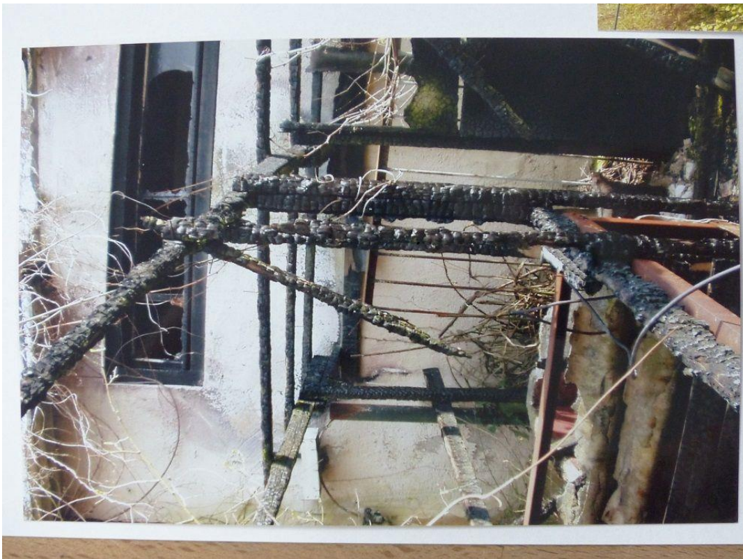
Boule-Club Rheingrafenstein e.V. - Ausgebrannter Keller