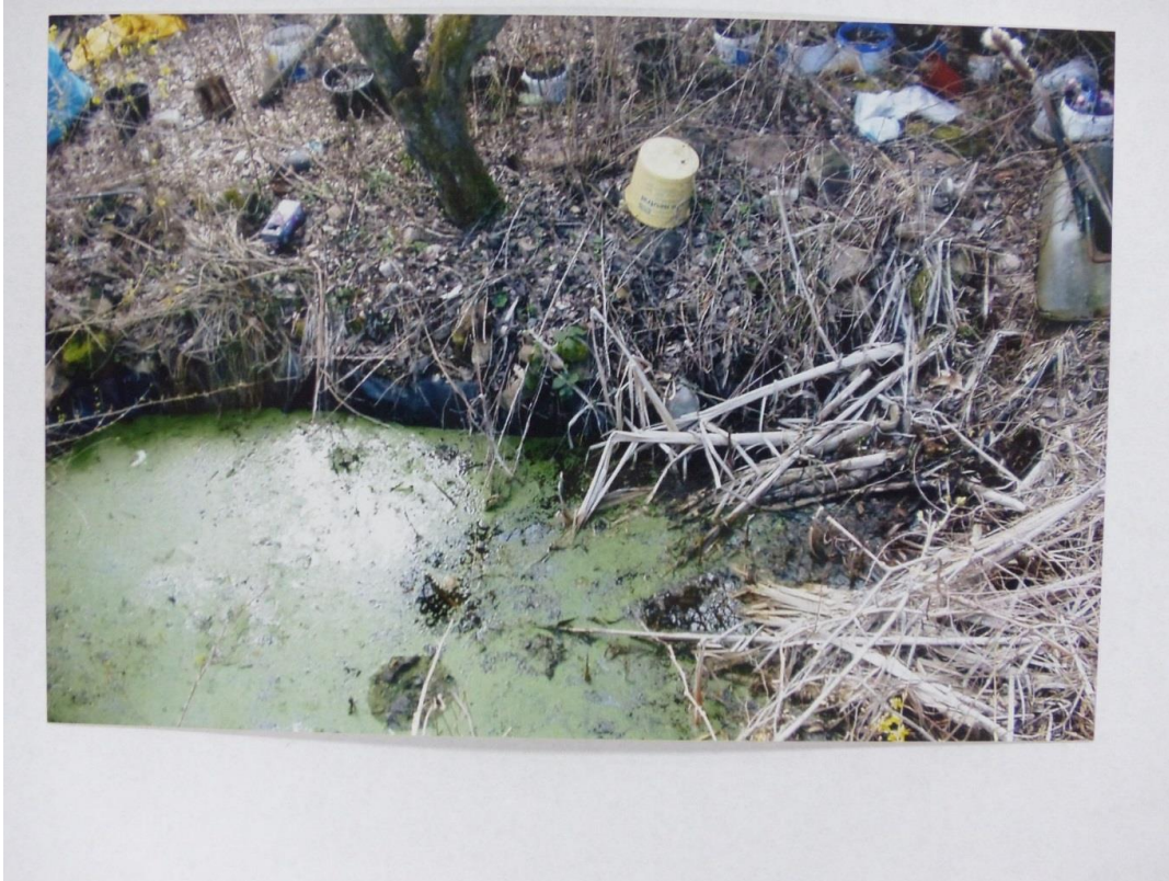
Boule-Club Rheingrafenstein e.V. - Tennisanlage 2003/04 (Alter Teich)