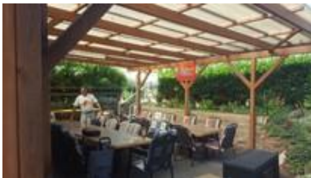
Boule-Club Rheingrafenstein e.V. – Terrasse mit defektem Dach 2018