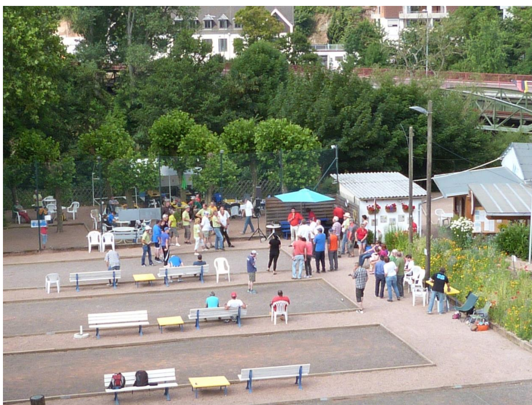
Boule-Club Rheingrafenstein e.V. - Plätze 1-3 2016