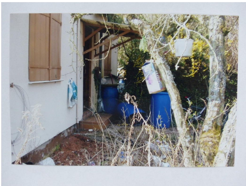
Boule-Club Rheingrafenstein e.V. - Vor dem Haus 2003/04