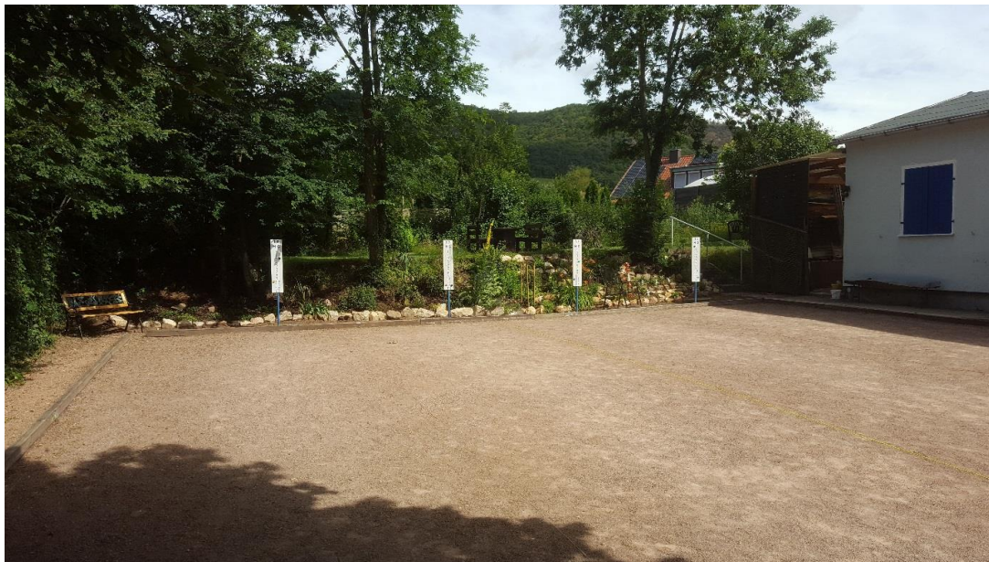
Boule-Club Rheingrafenstein e.V. – Plätze 15 bis 18