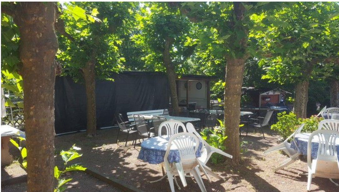
Boule-Club Rheingrafenstein e.V. – Aufenthaltsbereich 2018