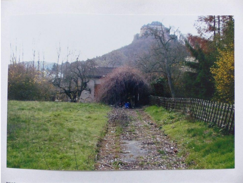
Boule-Club Rheingrafenstein e.V. - Eingang damals