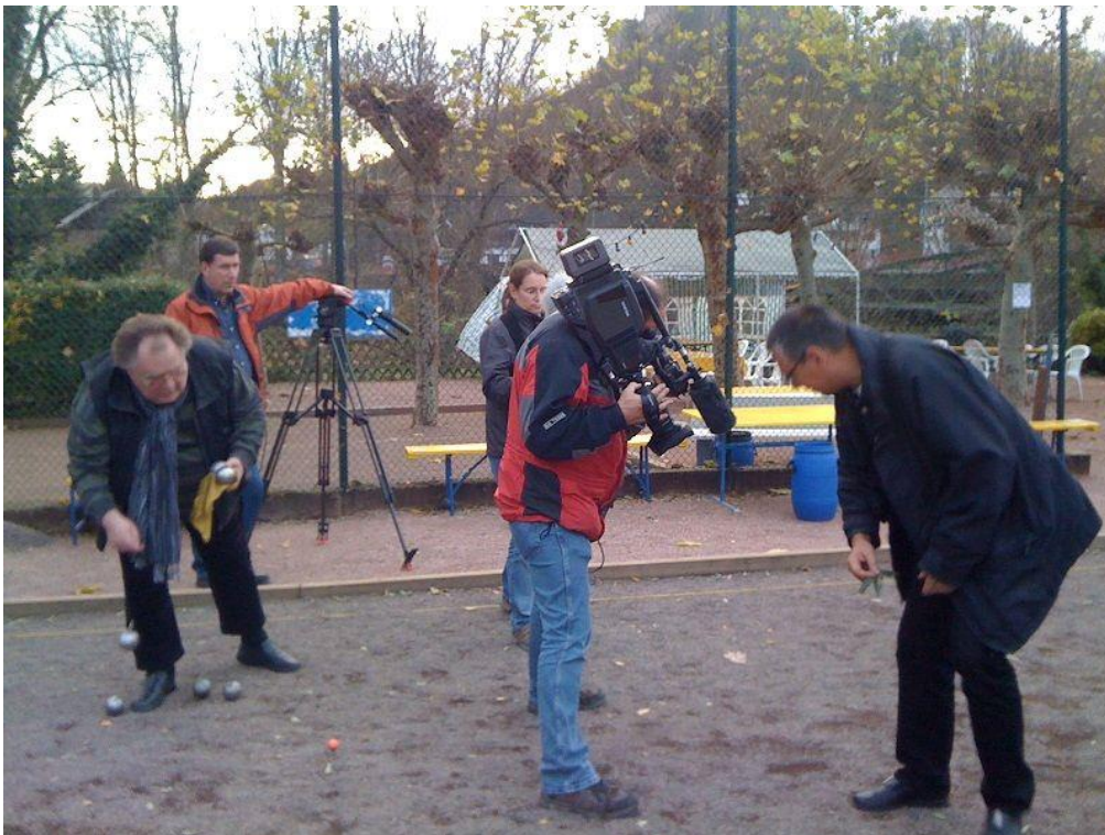
Boule-Club Rheingrafenstein e.V. - SWR-Team 2014