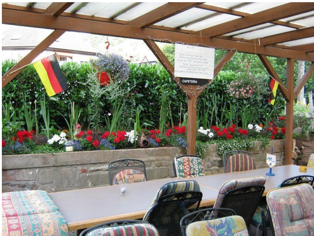
Boule-Club Rheingrafenstein e.V. - Vor dem Haus (Terrasse 2016)