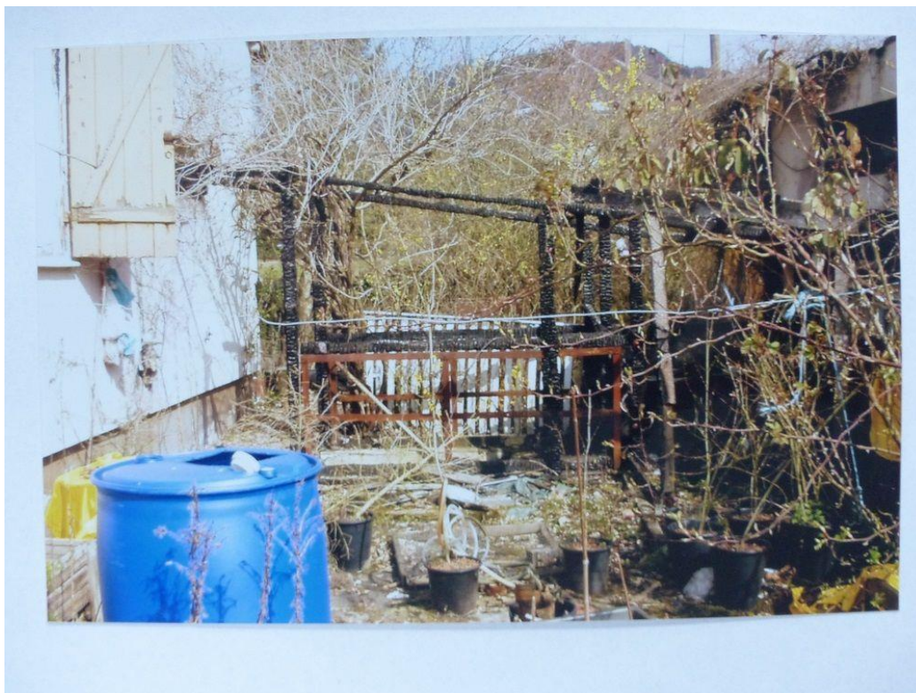
Boule-Club Rheingrafenstein e.V. - Hinter dem Haus 2003/04