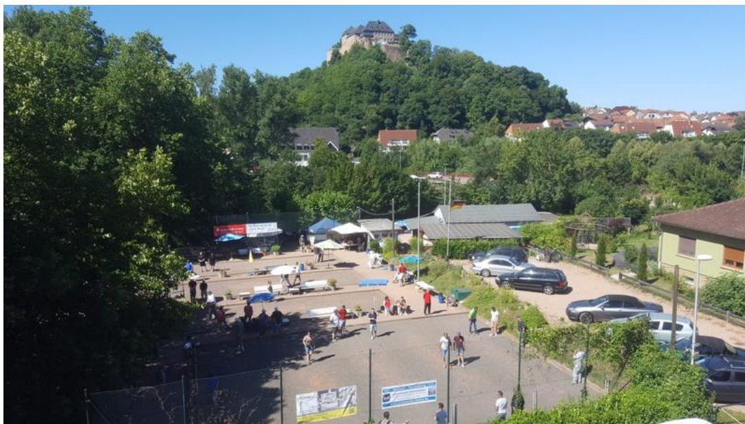
Boule-Club Rheingrafenstein e.V. im Juli 2018