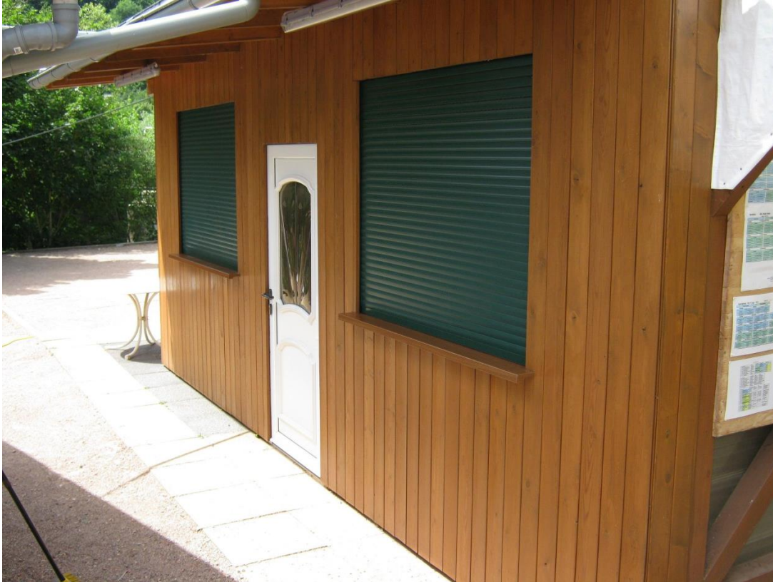
Boule-Club Rheingrafenstein e.V. – Außenküche