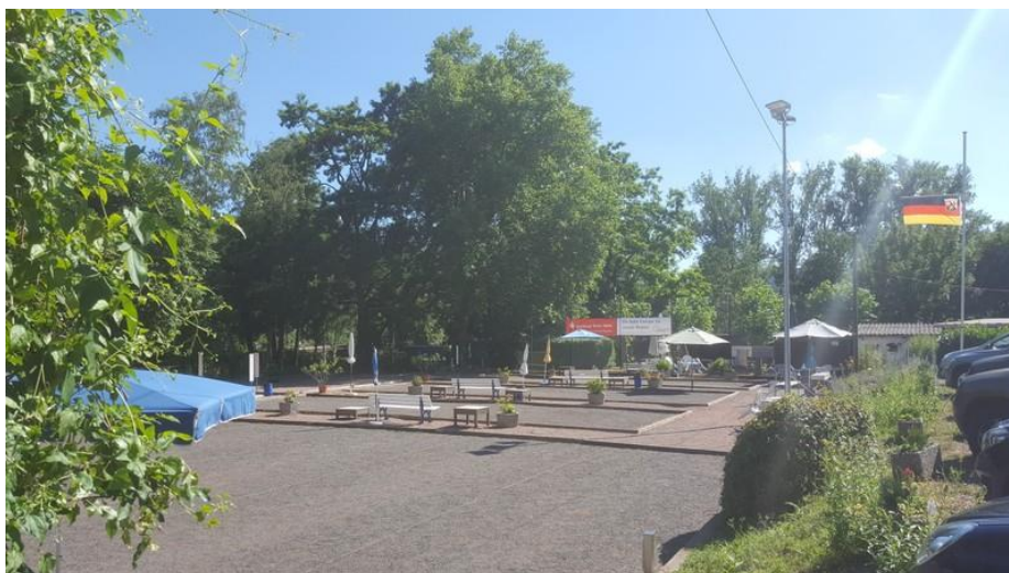
Boule-Club Rheingrafenstein e.V. - 2018