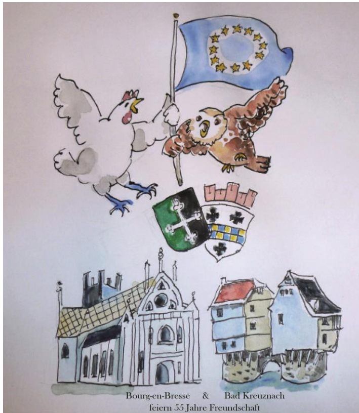
Zeichnung Fred Lex